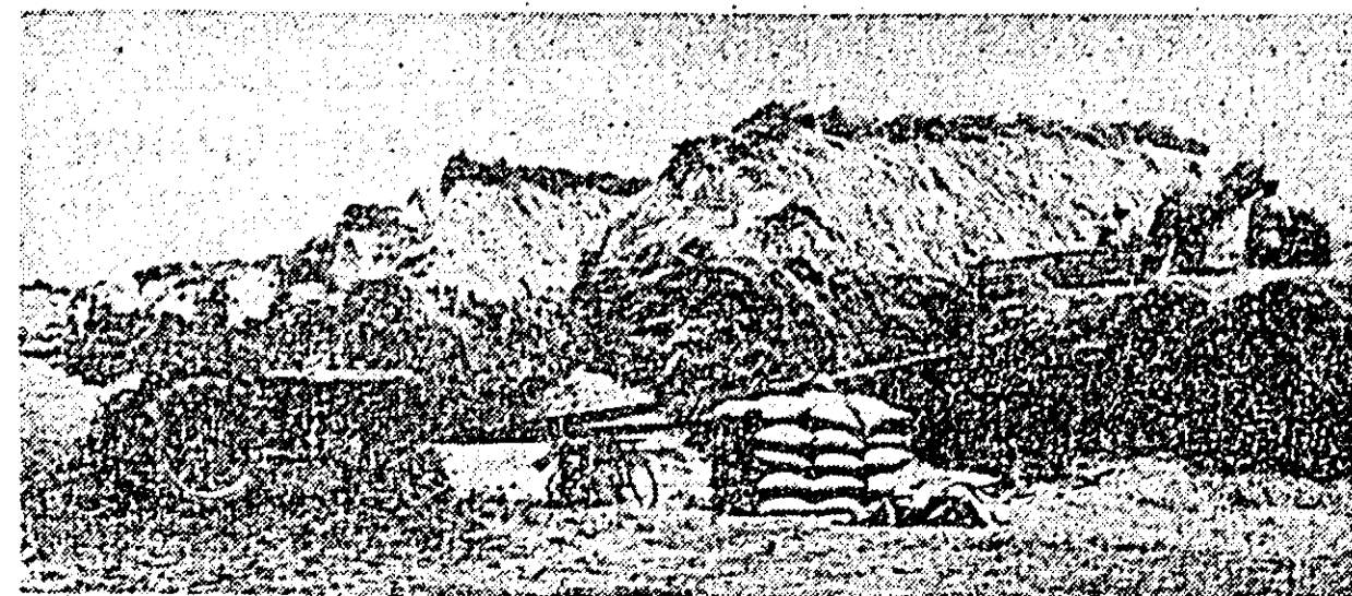
La cooperativa agricolă „Muregul” din Nădlac tot orzul a fost transportat la aril. IN CLIȘEU: la una din arși se desfășoară din plin treierul orzului.

Miercuri a părăsit Capitala dl. Rene Maheu, directorul general al UNESCO, care a vizitat țara noastră la invitația Universității din București. Directorul general a fost însoțit de Vasile Vlad, director adjuncț la invitația Universității din