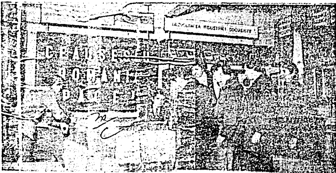
I.V.A., sectorul I. În deplină unanimitate, colectivul secției prelucrări mecanice spunea un hotărât DA, pentru pace și pentru dezarmare.

Pentru reducerea, de către Republica Socialistă România, cu 5 la sută a armamentelor, efectivelor și cheltuielilor militare au votat 16073621 cetățeni, adică 100 la sută din numărul total al cetățenilor cu drept de vot, participanți la referendum, și și-au exprimat opinia 1577353 tineri în vârstă de 14—18 ani, adică 100 la sută din numărul total al tinerilor care au fost consultați în cadrul referendumului.