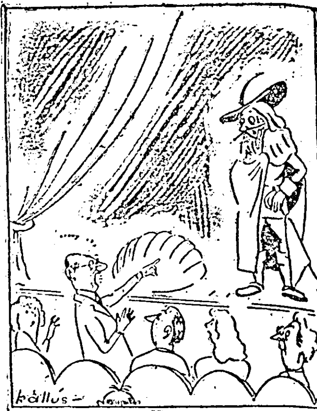
PROFESORUL SPECTATOR: Liniștit Ală parcă suflă cineval

Cel mai cunoscut fotbalist maghiar în anii de după primul război mondial a fost Schlosser Imre. El are un record unic în felul său: a îmbrăcat de 68 de ori tricoul cu stema Ungariei. In anul 1954, recordul lui Schlosser a fost oarecum întrecut de Puskás Ferenc, care în decurs de 9 ani (din 1945) a fost selecționat de 63 de ori.