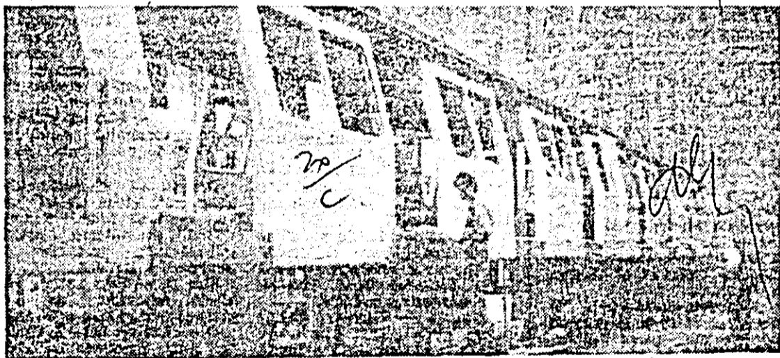
I.V.A. Aspect de muncă în secția montaj vagoane de metrou.