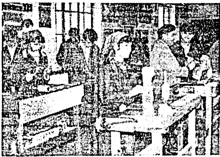
În atelierul de sculptură al Liceului Industrial nr. 5 Arad, elevii își însușesc cu mult sîrț tainele unei profesii mult apreciate și de înaltă specializare: sculptura în lemn.

Răspunzînd la aceste întrebări, precizăm că vom relua rubrica ziarului nostru pe teme de orientare școlară: „Ce meserie să ne alegem?”.