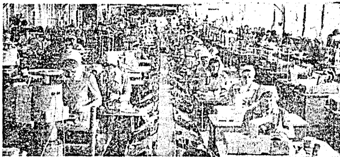
„Libertatea”: formația de lucru pregătii-cusut fețe A-2, condusă de Ersinia Vârzar este evidențiată pe secție.

Până la finele lunii, colectivul de muncă va livra suplimentar o producție de 169 mil perechi încălziminte pentru temel și copii.