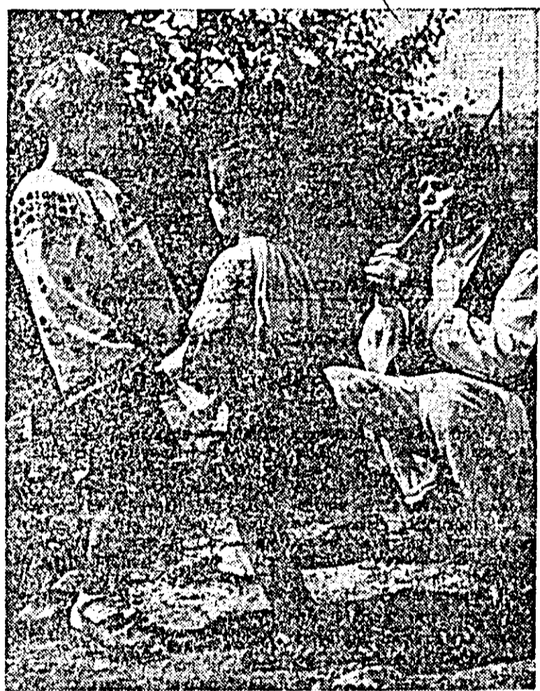
Asa-i locul pe la noi... (Foto: I. Popovici).