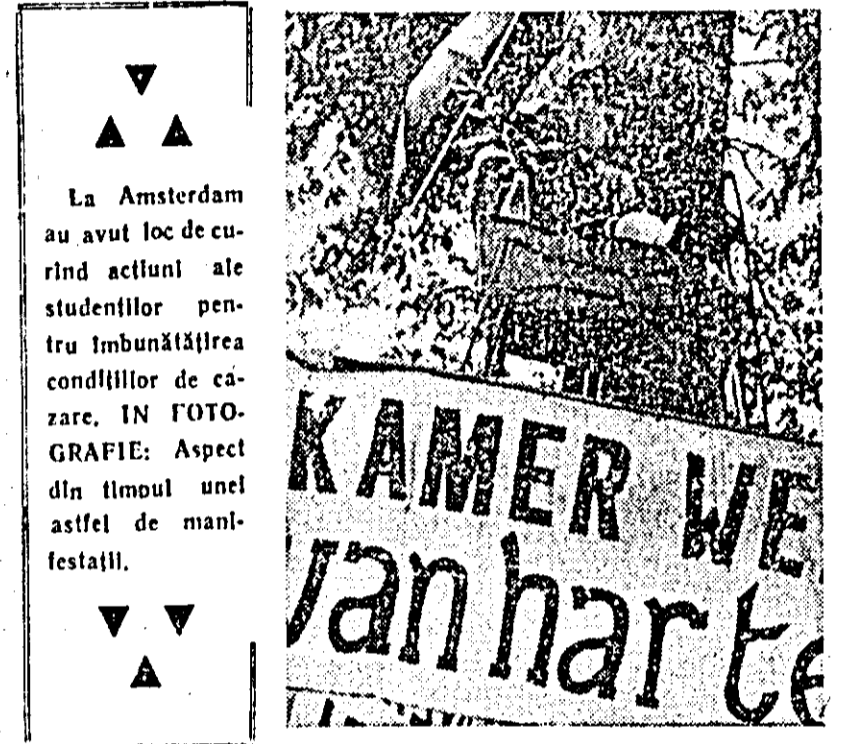
La Amsterdam au avut loc de curînd acțiuni ale studenților pentru îmbunătățirea condițiilor de cazare. ÎN FOTOGRAFIE: Aspect din timpul unei astfel de manifestații.

Eliberare din Vietnamul de sud, agenția VNA anunță că în perioada martie — sîrșitul lunii septembrie, forțele patriotice au scos din luptă aproximativ 5000 de militari americani. Numai în regiunile centrale ale Vietnamului de sud pierderile suferite de trupele americane s-au cifrat la 3709 soldați și ofițeri inclusiv șase companii și un pluton de infanteriști marini.