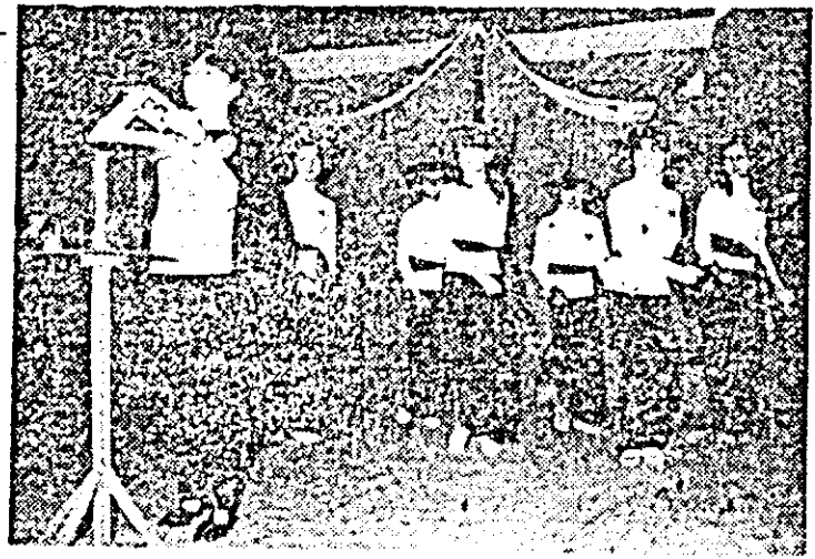
Pe scenă — brigada Școlii generale nr. 11 Arad.

interpretativă înaltă, un puternic mesaj patriotic și revoluționar transmis prin diferitele programe prezentate. În acest sens, se poate vorbi în termeni de apreciere despre răspunderea și seriozitatea cu care consiliile de conducere ale școlilor, organizațiile de pionieri și de U.T.C. din școli au abordat participarea elevilor lor la marea manifestare a muncii și creației care este Festivalul național „Cîntarea României”. Cu nimic mai prejos au fost calitatea și efortul organizatoric al Consiliului județean al Organizației pionierilor, al Comitetului județean U.T.C. Arad, care s-au străduit să ofere condiții optime bunei desfășurări a întrecerii sub toate aspectele. Jurile prezente au ales de-acum pe cei mai buni dintre cei buni. Cel 950 de artiști amatori laureați ai premiilor I care vor reprezenta județul nostru la Jaza pe țară vor trebui în continuare să dea o atenție deosebită pregătirii lor, afirmării și pe această cale a talentului lor, a elanului și pasiunii lor artistice”.