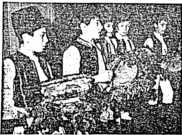
Pionierii Școlii generale din satul Avram Iancu (comuna Virfurile) prezentînd obiceiul folcloric „Dubășii”.

Pagină realizată de: CATALIN IONUȚAȘ, EMIL ȘIMĂNDAN.