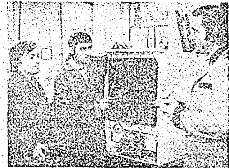
Aspect cotidian de la unitatea de reparații frigorifere de pe strada Mărășești.