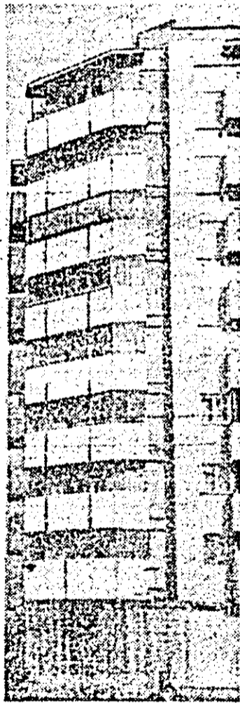
Verticale urbanistice arădene.