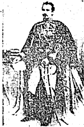
Alexandru Ioan Cuza — domnul Unirii. Pictură de C. P. Szathmary

„Epoca Ceaușescu”, epocă inaugurată de perioada de după cel de-al IX-lea Congres al partidului ne apare prin toate marile sale înfăptuiri care o definesc, drept una a continuității și consolidării depline a unității întregului nostru popor, a tuturor oamenilor muncii indiferent de naționalitate. În jurul secretarului general al partidului, exponentul cel mai fidel al marilor idealuri de propășire națională.