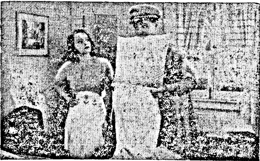
O scenă din filmul: CÂND FEMEIA SPUNE „NU”, care a rulat nu de mult la cinematograful „Apollo”.

Tribunalul a cerut unor experți să declare dacă talentul și creația Kristinei Söderbaum în filmul în chestiune suferă comparație cu Greta Garbo. Opinia experților a fost că performanța Kristinei este de cea mai înaltă clasă.