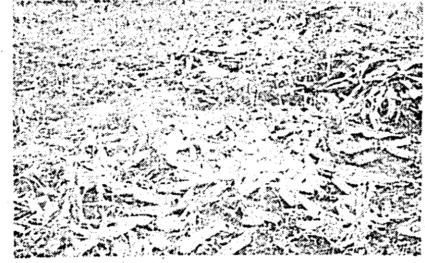
Porumbul care trebuia să fie deia în hambare, „zace” afară în cîmp, pradă întempestivilor și rozătoarelor.