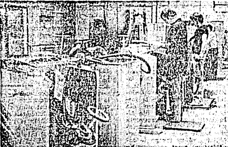
La întreprinderea textilă a fost dată în exploatare o nouă secție modernă de vopsit fire.

Îndeplinind planul pe primele nouă luni ale anului cu șapte zile înainte de termen, harnicul colectiv de muncă al Întreprinderii forestiere de exploatare și transport a realizat peste prevederile perioadei o producție suplimentară în valoare de 7,5 milioane lei. Prin valorificarea superioară a masei lemnoase, în sectoarele de producție ale unității s-a înregistrat o depășire a graficelor de livrări către beneficiarii interni concretizată în 2.000 m.c. lemn pentru celuloză, 1.000 m.c. lemn pentru mină, 600 m.c. cherestea de fag, 3.000 m.p. parchet, precum și produse de mobilă în valoare de 3 milioane lei. De asemenea, în cadrul contractelor de export, întreprinderea a livrat în plus în această perioadă produse în valoare de peste 700 mii lei valută.