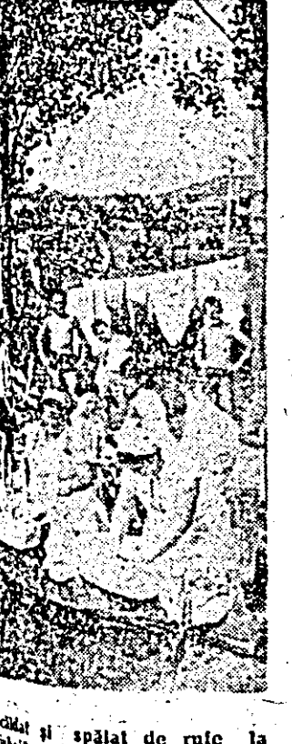
... și spălat de rufe la