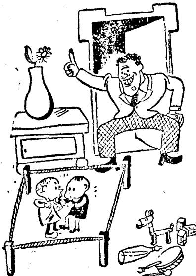
a nehézsúlyu boxbajnokéknál.

Nemcsak a C.F.R. engedélyez a LUNA BUCUREȘTI látogatóinak 50 és 75%-os kedvezményt