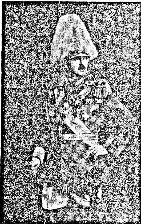
ŐFELSÉGE II. CAROL KIRÁLY

len ellenséggel találja magát szemben. Ezért, ha nem is láttam volna az állam elsőrendű szükségességét nemzeti védelmünk szempontjából a fegyvernem fejlesztésében, szívem mégis különösen értetek dobogott