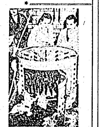
În orașul Naumburg din R. D. Germană industria locală a construit un ingenios agregat care jumulește zece păsări în timpul record de zece secunde.