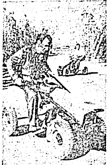
Uzina de automobile din Kutaisi (R.S.S. Gruzină) a început producția în serie a tractoarelor plice pentru bos-tănării și plantații. Viteza mașinii este de 5 kilometri pe oră. Ea este înzestrată cu unele suspendate: un cuilivator, un dispozitiv pentru săpat gropi și o cositoare.