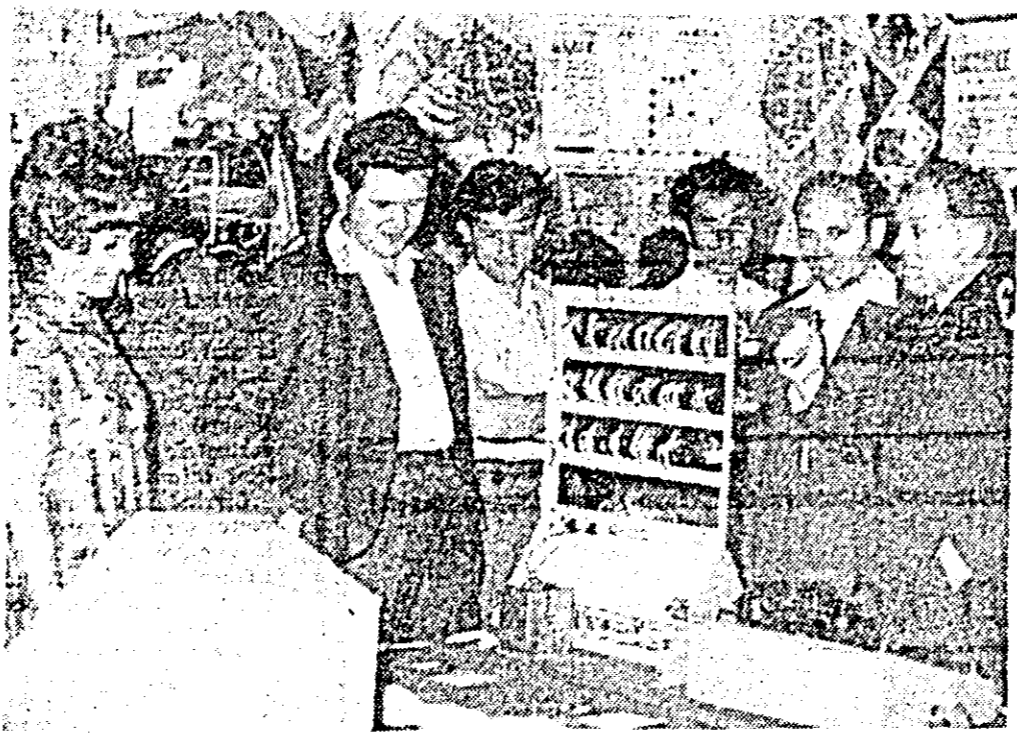
La casa corpului didactic a avut loc vernisajul expoziției tehnice a școlilor generale, profesionale, speciale și a liceelor de cultură generală și de specialitate din județul Arad. Aspect din cadrul expoziției.