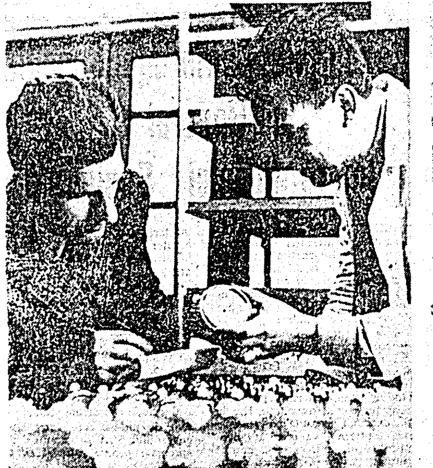
Fabrica de ceasuri „Victoria” din Arad. La controlul de calitate a produselor exigența este prezentă.

ART. 29. — Prezenta lege intră în vigoare după 30 de zile de la publicare.