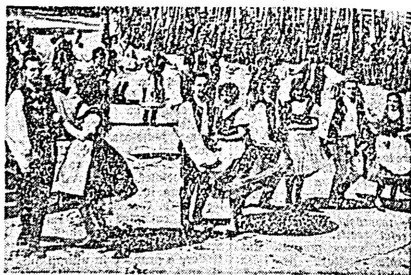
In ritmul melodilor populare, răsundă sprînten jocul artiștilor amatori.