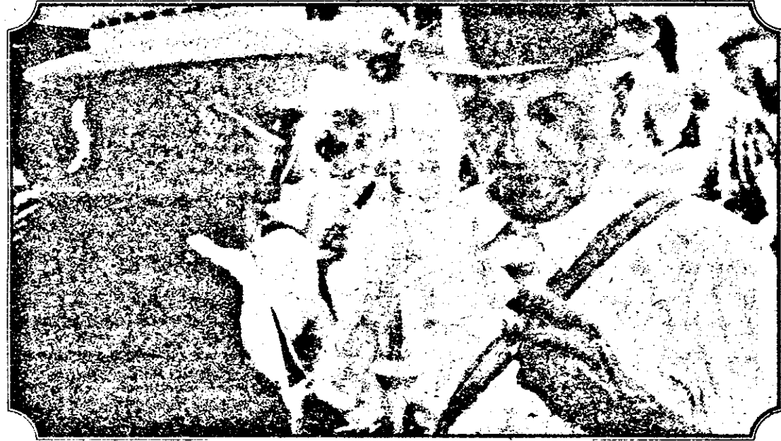
- Ce părere ai de Inghetata Scholler? - Eu prefer mai bine o „Dreher”!