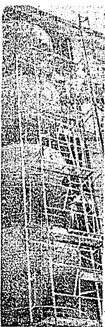
Pe schete, edificînd, în municipiul, noi și noi blocuri de locuințe pentru oamenii muncii