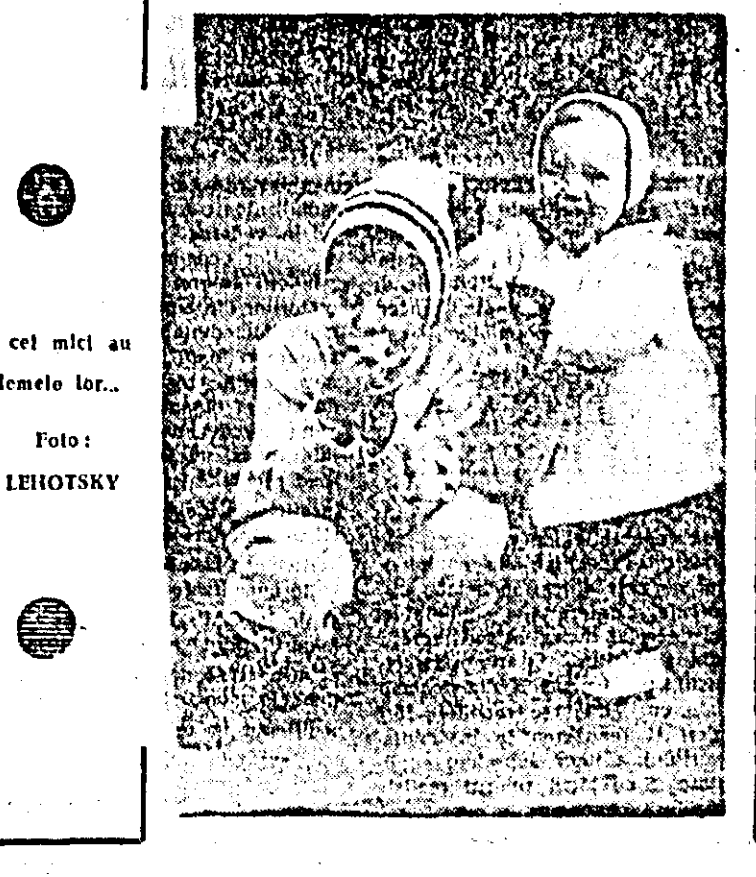
Și cel mic al problemei lor...

Vorbitorul a accentuat în continuare asupra necesității îmbunătățirii metodelor și stilului de muncă ale organelor și organizațiilor de partid, urmîndu-se angajarea tuturor comiștilor în sarcini concrete, dezvoltarea democrației socialiste în toate domeniile de activitate, intensificarea muncii cultural-educative, Comitetul orașenesc de partid nou așezat va trebui să mobilizeze pe toți oamenii muncii la ampla acțiune inițiată de Comitetul județean de partid, fiecare cîștigînd un bun proprietar, gospodari și producători”. Prin-o intensă muncă politică de masă, să se întreprindă acțiuni care să ducă la prelîngirea încălzirii normelor etico-morale socialiste, a legilor statului. Au fost, de asemenea, relectate posibilitățile și rezervele existente în munca de gospodărire și cea edificată, astfel ca orașul Curtici să se situeze în rîndul celor mai frumoase, orășe ale județului.