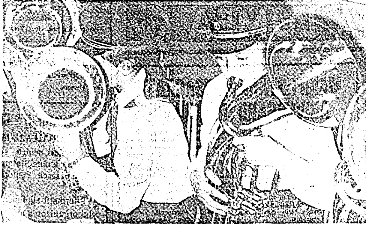
Fanlaria pionierilor din Comlăuș, laureată a concursului „Trompeta litoralului”.

Coroziunile de neajunsuri, pe care războiul le-a produs industriei arădene, nu poate fi însă limitată la aspectele semnalate până aici. Un efect deosebit de distructiv l-au avut bombardamentele aeriene, care au provocat pagube de sute de milioane întreprinderilor afectate, dezorganizându-le producția, înstrășându-le și haosul economic. Bombardamentul din 3 iulie 1944 a svariat grav Fabrica de tricotat și tricotatului.