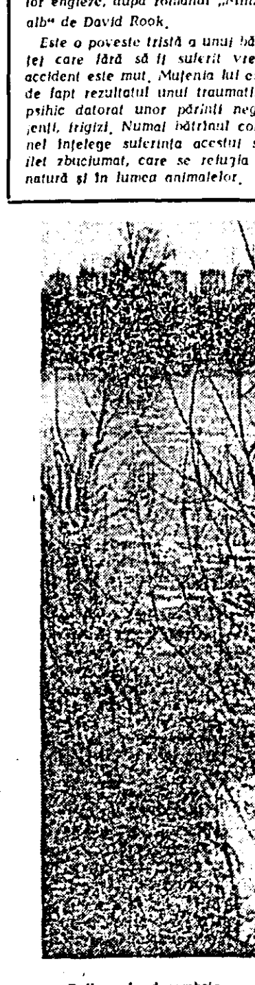
Reliefe în decembrie

Filmul „Alteargă repede, alteargă liber” este o realizare a studiourilor engleze, după romanul „Minutul alb” de David Rook. Este o poveste tristă a unui băiețel care lădă să îl salveze vîntul accident este mort. Măfuenia lui este de fapt rezultatul unui traumatism psihic datorat unor părinți neglijenți, irigizi. Numai bătrînul colonel înțelege suferința acestui suferitor zăcut, care se refugiază în natură și în lumea animalelor.