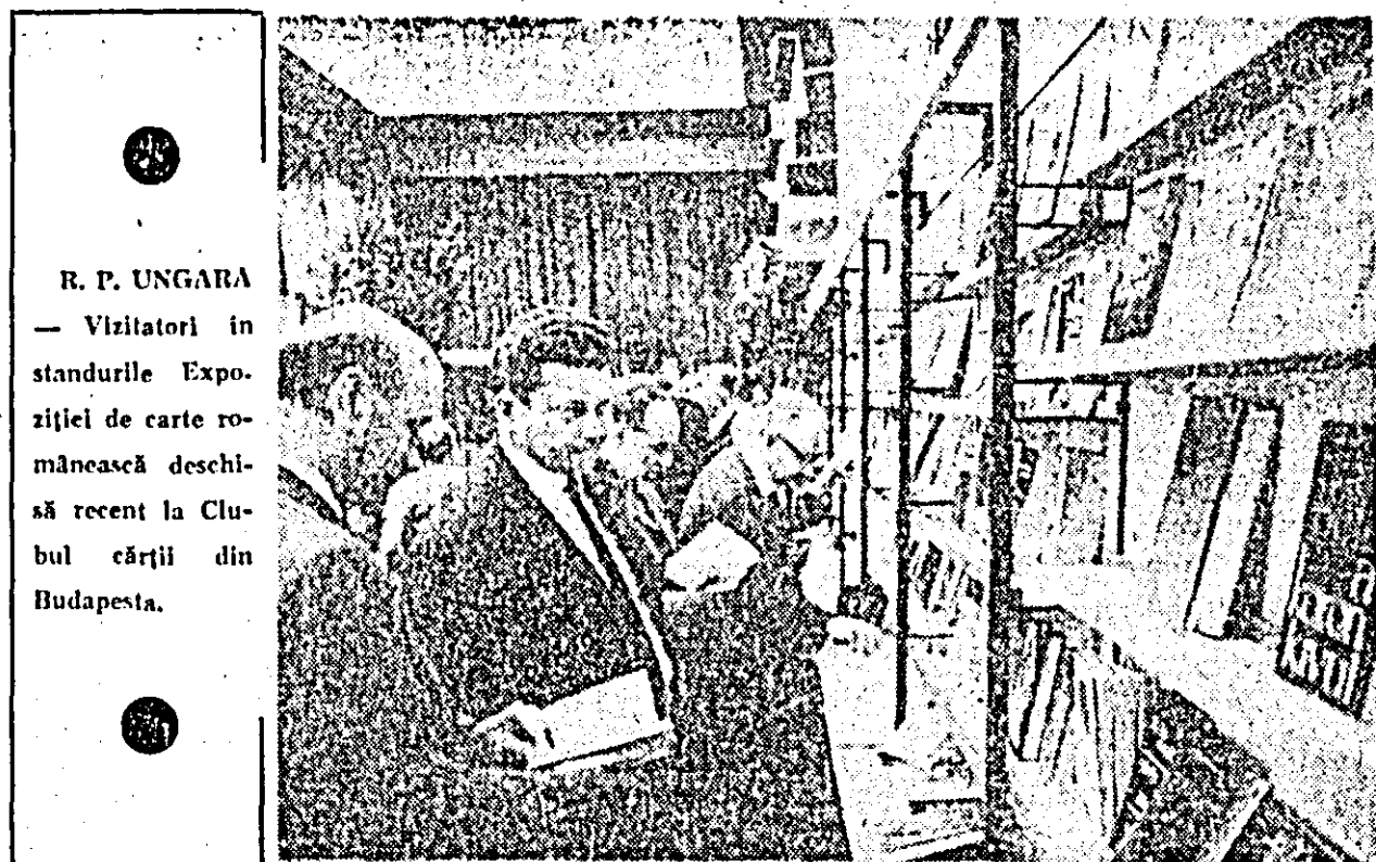
R. P. UNGARA — Vizitatori în standurile Expoziției de carte românească deschisă recent la Clubul cărții din Budapesta.

Referindu-se la naționalizarea marilor instituții bancare, primul ministru al Indiei a precizat că această hotărîre a guvernului este numai un prim pas în acțiunea de consolidare a independenței economice a țării. Multe alte măsuri vor mai trebui să fie luate — a declarat Indira Gandhi — pentru ca toate straturile populației Indiei să beneficieze de roadele independenței politice și economice a țării.