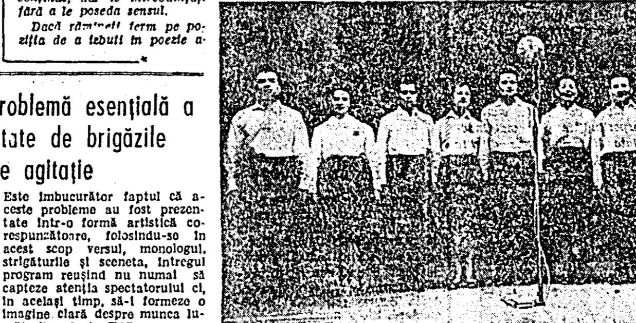
Interpreții brigăzilor artistice de agitație de la COA s-au bucurat de mult succes în programul pe care l-au prezentat. IN CLIȘEU: un moment din timpul prezentării programului.

In săptămîna care s-a scurs au continuat să se desfășoare intrerile artiștilor amatori în cadrul celui de al IV-lea concurs artistic regional. Cele două faze care s-au desfășurat în acest interval au fost dominate de prezența numeroasă a brigăzilor artistice de agitație și a solistilor vocali. Îndrăgite mult de oamenii muncii din întreprinderi și instituții, care găsesc în programele de brigadă o mijloc eficece pentru înlăturarea lipsurilor, de stimulare a elanului în muncă, aceste formații artistice s-au dezvoltat simțitor de la un an la altul. Ca dovadă, în actuala ediție a concursului regional ele s-au prezentat la un nivel mult mai ridicat, atît din punct de vedere al conținutului cit și al formei de prezentare. Pe această linie se situează programul brigăzilor artistice de agitație de la TAPL. In centrul tematicii, creatorii textului au situat o problemă foarte actuală — lupta pentru calitate. Ca în toate sectoarele de activitate, și lucrătorii de la TAPL sînt preocupatî de această problemă. Textul a ilustrat cîteva din aceste preocupări: aprovizionarea cu sortimente cit mai variate și de sezon, servirea conștiințoză a consumatorilor, atitudinea nouă față de muncă etc.