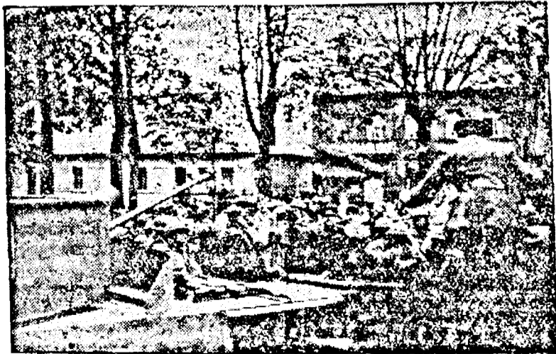
Trupele franceze au aruncat un pod în aer la extremitatea frontului

Ministrul de interne a anunțat oficial în parlament, că numărul provizoriu al morților cutremurului de pământ din Anatolia se ridică la 25.000, răniți 8000 și de ape au fost distruse 30.000 case.