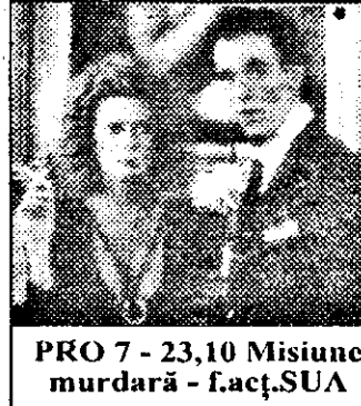
PRO 7 - 23.10 Misiune murdară - f. act. SUA

6.50-13.00 Desene animate 13.00 Batman - f. SUA, 1986 14.00 Parker Lewis, spaima școlii - s. am. 1990