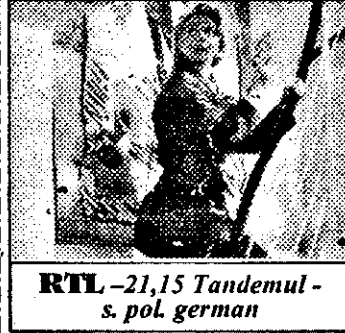
RTL - 21,15 Tandemul - s. pol. german

6,30 Viața satului 6,50 Jurnal regional - Pécs 7,00 Magazin matinal 7,01 Stiri 7,40 Reuters - jurnal economic 7,55 Povesti 10,00-13,00 Albastru - magazin. Din cuprins: 10,35 Concurs TV 10,45 Familia Hagenbeck - s. Germania: Vremuri grele 12,20 Concurs TV 12,30 Helena - s. Italia 23/7 - Copie perfectă 13,00 Stiri 13,05 Magazin economic - Pécs 13,55 Teletext 15,05 Prezentarea programului 15,10 Viața satului - rel. 15,30 Contemporani 15,45 Ajutor! - emisiune medicală 16,00 Cultura cu multiple fete - doc. am. XXI/19 - Supraviețuirea presupune schimbare 16,30 Meditații la fizică 17,00 Stiri, meteo 17,05 Televideo '94 17,10 Telefonată! - concurs TV 17,30 Domnișoara - s. Brazilia 170/17 18,00 Dimensiuni - mag. informativ 18,40 Cânturi despre Sf. Nicolae 18,50 Crăciunul Mare în Sala sporturilor