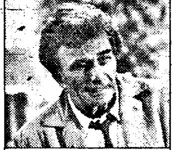
BUDAPESTA 1 - 21.15 Colombo - s. pol. SUA

8.30 Hello, Austria - magazin 9.00 Știri ITN 9.30 Jurnal european - magazin 10.00 Video-moda