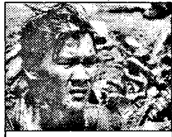
PRO 7 - 21.15 Câmpurile ucigașe - f. răz. Anglia

6.28 Prezentarea programului 6.30 Viața satului 6.50 Jurnal regional: Pecs 7.00 Magazin matinal. Din câmpina...