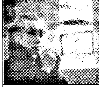
PRO 7-21,15 Marie - O poveste adevărată - f. SUA

12,00 Tânăr și fără odihnă - s.SUA: Descoperirea Ginci 12,45 Risc! - concurs TV 13,30 Sub soarele Californiei - s.SUA: Spionaj economic 14,25 Tarzan - s. SUA: 16 ore pentru viață