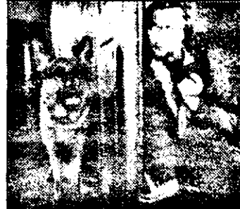
SAT1-21,15 Comisarul Rex - s. pol. germ.; Dans pe vulcan

10.30 Falcon Crest - s. am. - rel. 11.30 Vecinii - s. Australia: Cel mai bun din clasă 12.00 Tânăr și fără odihnă - s. SUA: Tatăl Ginei 12.45 Riscă! - conc. tv