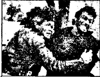
PRO7-23,10 Lege martială - f. acț. SUA 1991

6.30 Viata satului 6.50 Jurnal regional - Szombathely 7.00 Magazin matinal; Stiri 7.40 Reuters - jurnal economic 7.44 Povesti 10.00 Albastru - magazin 10.35 Concurs tv 10.45 Familia Hagenbech - s. germ. XII/4 12.20 Concurs tv 12.30 Helena - s. italian 23/14: Voi fi vestit 13.00 Stiri 13.05 Jurnal economic 15.20 Viata satului 15.40 Studio deschis 15.50 Muzică 15.55 Afaceri, întreprinzători 16.10 Răsfoind programul tv 17.00 Stiri 17.05 În așteptarea guvernului 17.30 Domnișoara - s. Brazilia 18.00 Magazin cultural central - euro-