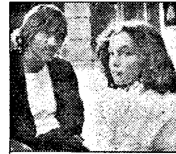
PRO 7-0,00 Man on Fire - f. It./Fr. 1986

6,35 Desene animate 7,50 Flipper - s.am. Flipper și spionul 8,20 Waltonii - s.am.: Primul nepot 2 9,20 Micuța noastră fermă - s.am. 10,20 Harry și fiul - f. SUA 1983 cu Paul Newman, Robby Benson, Joanne Woodward 12,30 Compania celor trei - s.am.: Dumnăic vechi 13,00 Sperietoarea și Mrs. King - s. pol. am.: O fură pe Amanda