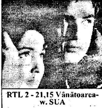
RTL 2 - 21.15 Vânătoarea-w. SUA

15.25 Tarzan - s. SUA: Salvați rinocerii 15.55 Star Trek - s. sf. am.: Ce repede trece timpul