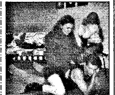
RTL - 18,30 Intre noi - s. german

9,00 Stiri ITN 9,15 Bursa SUA 9,30 Jurnal NBC 10,00 Super shop 11,00 Rolunda talkshow 12,00 Rivera show 13,00 Magazin economic mondial 13,30 Financial Times 14,30 Azi-magazin informativ 15,30 Financial Times 16,00 Euro-magazin informativ 16,00 Roata banilor - informații de pe Wall Street 18,30 Financial Times 19,00 Azi-magazin informativ 20,00 Stiri ITN 20,30 Auto-Cupa ADAC '94 21,30 Datinile- magazin politic 22,30 Ediție internă 23,00 Stiri ITN