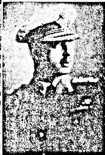
M. S. REGELE CAROL II

...măria Municipiului Timișoara a ...o înștiințare telegrafică de la Casa Regelui prin care i se aduce la cu- ...că Suveranul a donat suma de ...000 pentru săracii orașului cu pri- ...sintelor sărbători.