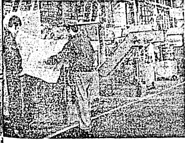
Colectivul secției montaj a Întreprinderii de strunguri a obținut în cîntec Congresului al XII-lea al partidului frumoase rezultate în muncă.

importante depășiri la export și anume 42 vagoane și 80 mil sticle cu vin. Menționăm că plină la sfîrșitul anului în curs, hărnicia oamenilor muncii de la I.V.V. se va concretiza într-o producție suplimentară de circa 17 milioane lei peste prevederile planului anual.