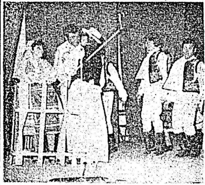
Moment din spectacolul brigăzii artistice din Macea.

CONCURE JUDO: In sala S. Gloria, va avea loc zilele de 10 și 11 ale a.c. o mare complex de judo, la care-ai anunțat participarea sportivilor din mai de județe ale țării. Cursul este organizat de către A.S. Strungul care a înființat, mai noua secție de p-