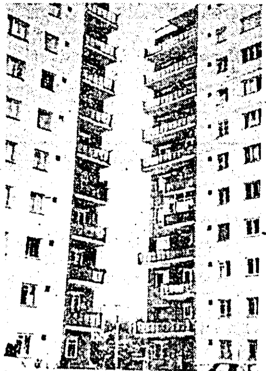
Siluele arhitectonice arădene.

Specialiștii filialei din Iași a Institutului de cercetare științifică și inginerie tehnologică pentru industria electrotehnică, ICPE, au conceput, proiectat și realizat, pentru prima dată în țară, un filtru electrostatic de 1700 mc pe oră, destinat purificării aerului introdus în incinte, procese tehnologice sau sisteme care presupun condiții speciale de puritate atmosferică.