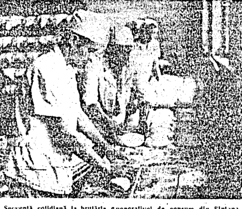
Secvență colidantă la brutăria cooperativei de consum din Sîntana.

acesta am început livrarea roșilor la data de 11 iunie și pînă la 21 iunie, cînd începăm în alți ani livrarea, ne-am și realizat planul. Apoi și calitatea produselor noastre a făcut să livrăm tot ce am produs, legumele noastre fiind mult solicitate de beneficiari. Din experiența acestui an s-au tras prețioase învățămînte pentru activitatea de viitor în legumicultură, urmîndu-se să se obțină nu numai producții cit mai mari la hectar, ci mai ales legume timpurii și de bună calitate. Pe linia acestor preocupări s-au însămninat două ha cu salată în tin solă se vor cultiva la început gulbore, ca primă cultură, după care vor urma roșile. La cultura de tomate, altă în solă cit și în timp, se va urmări de asemenea să se obțină o producție cit mai timpurie, astfel încît să se recolteze și să se valorifice începînd cu primele zile ale lunii iunie.