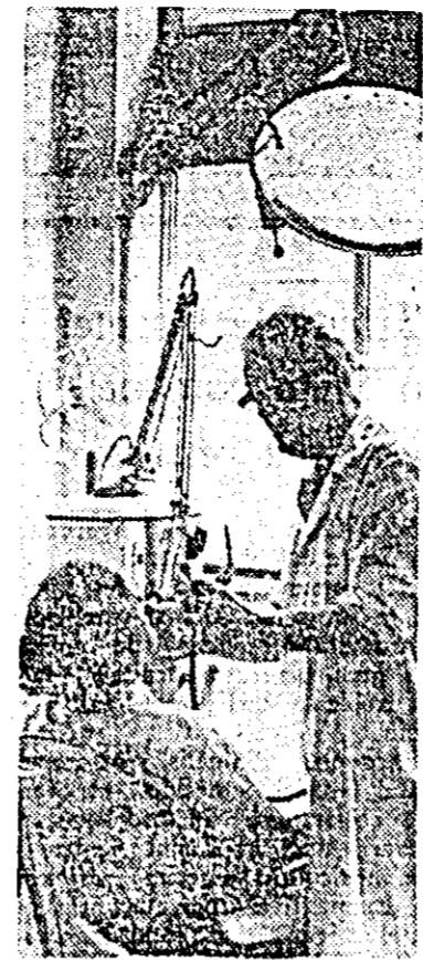
La Policlinica din Așd s-a dat în folosință un cabinet de stomatologie. Aparatele moderne cu care s-a dotat, cadrele de înaltă specialitate care lucrează aici, asigură un tratament calitativ.