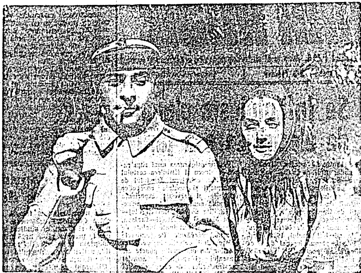
IN CLIȘEU: O scenă din film.