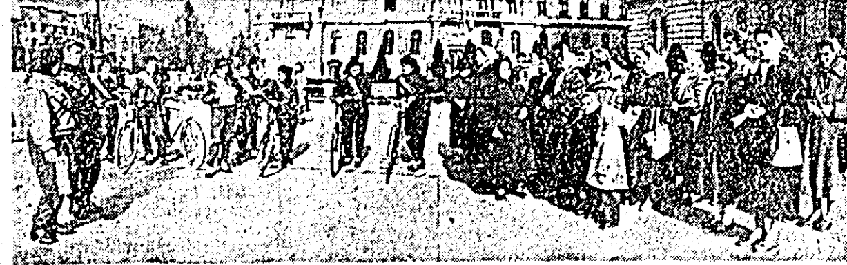
Alăturatei au sosit în orașul nostru (vezi clișeu) delegații ale femeilor din raioanele Pecica, Lipova și Arad, care au adus femellelor din oraș mese ajul femellelor din aceste raioane, închinat zilei de 8 Martie.

Ieri, la orele 12, ștafeta 8 Martie a plecat din orașul Arad spre Timișoara, de unde, trecînd prin alte regiuni ale țării, va ajunge la Consiliul național al femeilor din R.P.R.