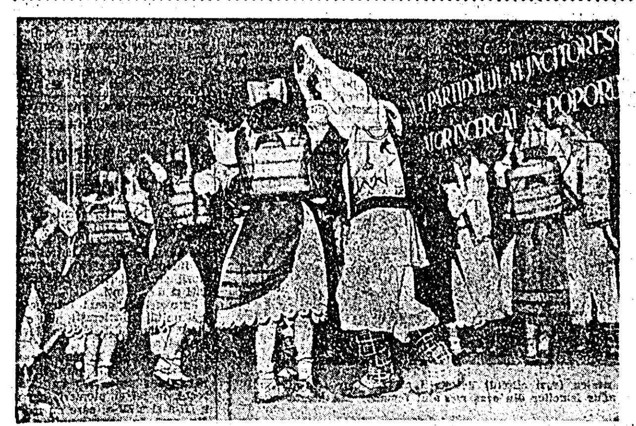
Formația de dansuri a clubului CFR are un bogat și variat repertoriu. Clișeu reprezintă un aspect dintr-un dans popular prezentat de această formație.

5.000 kg fier vechi Zilele trecute, din inițiativa Comitetului executiv al Statului popular orășenesc salariații statului împreună cu deputații au întreprins în cartierul Grădăștie o acțiune de colectare a fierului vechi. Cu această ocazie s-au colectat peste 5.000 kg fier vechi. S-au distins în mod deosebit salariații secției finanțe și gospodăriei comunale. Acțiunea continuă în zilele acestea și în alte cartiere ale orașului.