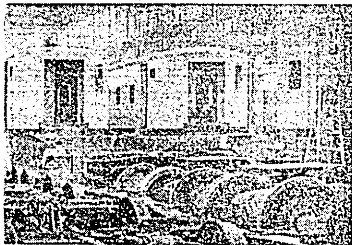
Aspect de muncă în secția (Insa) a fabricii de vagoane pentru călători, L.V.A.

Întreprinderea de mașini-unelte Arad. În secția montaj se execută ultimele finisaje la un lot de strunguri destinate unor beneficiari externi.