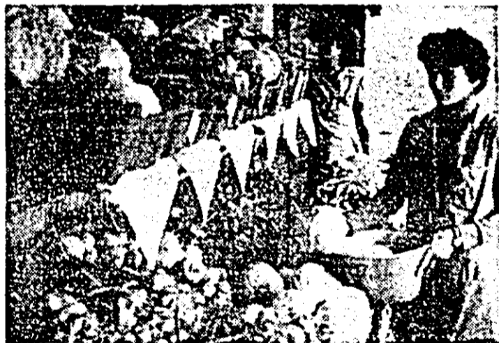
Aspect din unitatea nr. 8 a I.C.S.L.F. din piața Mihai Viteazul.