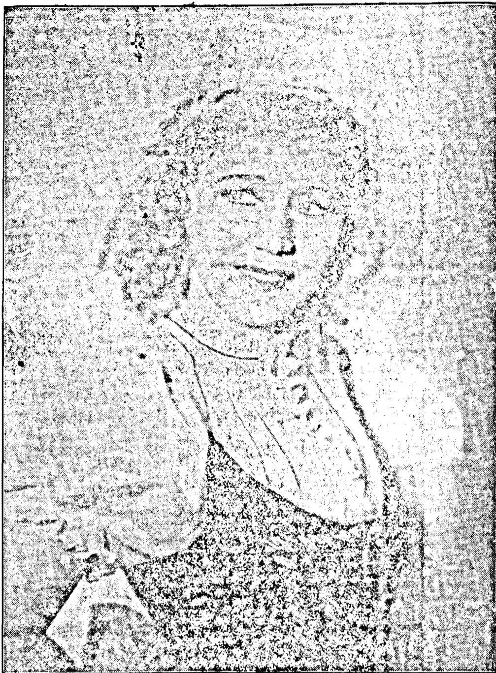
Prwighetoarea Germaniei Erna Sack care va apare în curând în marele film al casei Ufa „Nanon”

Filmul „Melodia unei Nopti” se încheie fericit cu ultimul act din Don Juan la opera din Praga și astfel ni se oferă prilejul admirabil să savurăm muzica divină din opera nemuritoare și în același timp să asistăm la scena emoționantă a aclamării entuziaste a compozitorului Mozart de către publicul de premieră din Praga, fascinat de muzica geniului dela Salzburg.