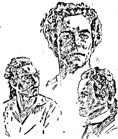
Horst Caspar ca Schiller (Timpul unui geniu)

Publicul românesc a dat dovadă de un gust rafinat admirabil filmele germane „Bismarck”, „Evreul Süs”, etc. Din aceeași galerie face parte și noul film „Friedrich Schiller”, sau „Triumful geniului”. Ceace-i va asigura succesul aceluiași săli p'ine și aceeași primire entuziastă a cinesfîlor.