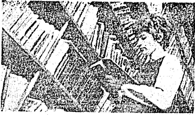
La biblioteca Școlii profesionale textile.