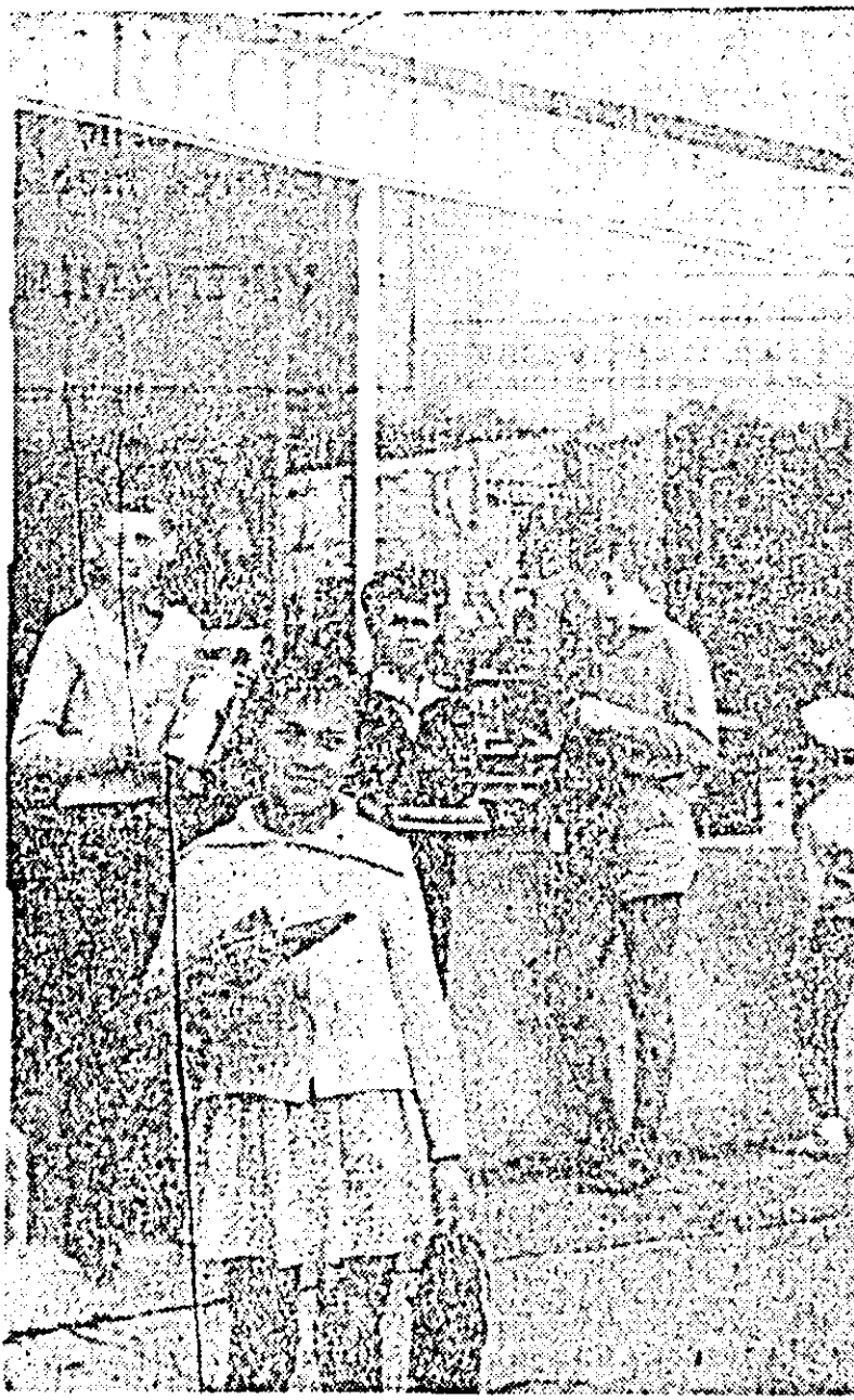
Ne pregătim pentru școală

CENTRUL NR. 8 (strada Armata Poporului nr. 37 — în 14 IX strada V. Babes, iar în 15 IX D. Bolintineanu și Căminului.