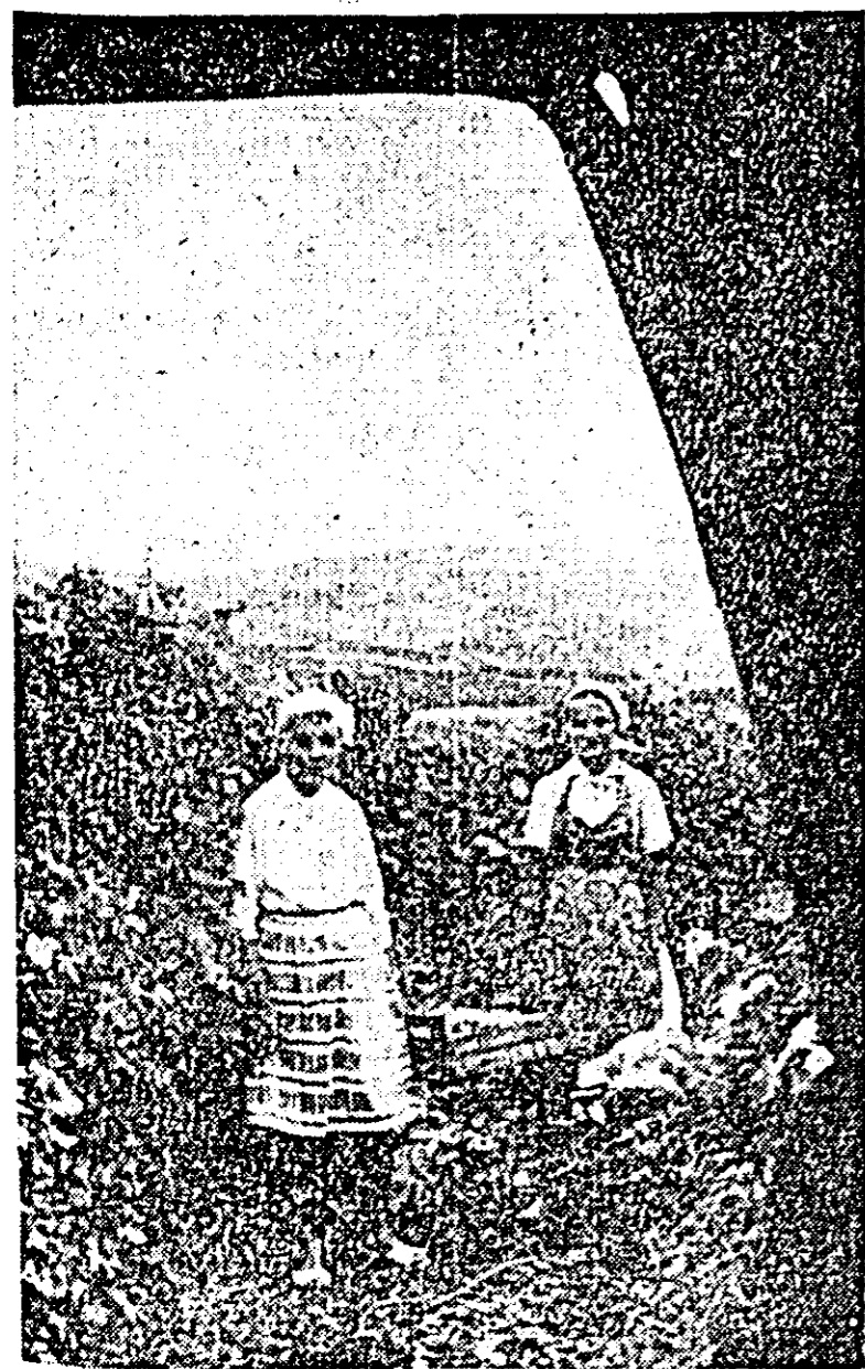
Aspect cotidian în vilele gospodăriei de stat din Siria. Recoltatul strugurilor de masă din soiul Chasselas antrenează zeci de muncitori dintre care, în clișeu de față, vă prezentăm doar două.