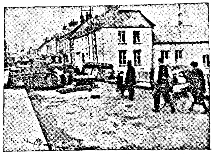
Populația franceză și belgiană care s'a refugiat în sudul Franței, se întoarce acum la vatră. Străzile n'au fost curățate încă de armele ucigăse; ele stau deacurmezișul drumurilor amintind trecătorilor de grozăvia zilelor pe care le-au trăit

BUCUREȘTI, 14 (Sir). — Societatea culturală „Timoc”, a românilor din Valea Timocului și dreapta Dunării, urmărind îndeaproape desfășurarea evenimentelor în legătură cu românii din Bulgaria, atrage serios atenția la faptul că: românii din Bulgaria sunt de trei ori mai numeroși (250.000) decât arată statisticile bulgare. În acest scop vor fi publicate toate documentele existente. Drepturile României, în mod firesc, sunt cu mult mai mari și cu mult mai largi, susține comunicatul societății.