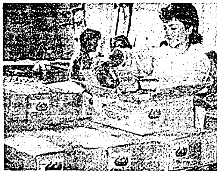
Aspect din secția ambalaj a I.P.I.L.F. „Refacerea”.

În ce privește însămînjările, în cursul zilei de ieri s-a încheiat atît semănatul culturilor furajere pe cele 685 ha prevăzute cît și a orzului pe 850 ha. Tot miercuri a fost declanșat semănatul grîului, lucrare deosebit de importantă pentru viitoarea recoltă. În vederea asigurării unei calități deosebite, inginerii șefi, șefii de fermă, ceilalți specialiști din fiecare unitate sint prezenți la fața locului, asigurînd realizarea unei densități optime de boabe pe metru pătrat, a adîncimii prevăzute precum și o distribuție uniformă a semințelor care au fost alese din soiuri de mare productivitate pentru această zonă (Fundulea-29, Lovrin-41), din categorii biologice superioare.