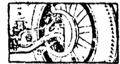
A Chevrolet szállítókocsinak négy keréktája van.