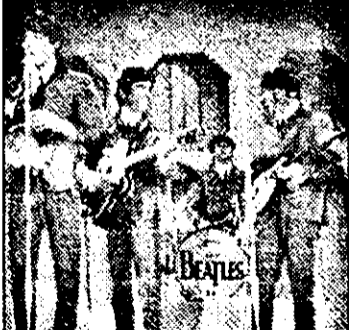
BUDAPESTA 2: 18,00 Antologie Beatles

6,55 Time Trax - s. sf. am. 7,45 Mac Gyver - s. am., rel. 8,35 Star Trek - s. sf. am., rel. 9,25 Star Trek - Stația orbitală nr. 9 - s. sf. am., rel. 10,15 Marea aventură a lui Pee Wee - comed. SUA cu: Paul Reubens 11,50 Vânătorul de cerbi - w. SUA cu: Lex Barker, Rita Monero 13,10 Primăvară berlineză - f. Germ. 14,35 Copoiul - comed. Fr. cu: Louis de Funès, André Bourvil 17,00 Corsarul roșu - f. av.