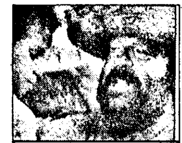
PRO 7: 21,00 Banana Joe - fact. comed. SUA

18,10 Iară-mă - show 19,00 Zi de zi 20,25 TG4 - știri 20,55 Sailor Moon - desene animate 21,15 Puffi - desene animate 21,00 Sailor Moon - desene animate 21,40 Una mai mult - dramă SUA, 1983 cu Joanna Kerns 23,40 Niciunul - dramă Italia cu