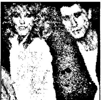
PRO 7:23,35 Moarte pe pod - f. pol. SUA

8,00 Desene animate 9,30 Insula misterioasă - f. s. pentru copii ep. 6 10,00 Arunc-o pe mama din tren! - f. SUA, 1987 12,00 Sequest - rel. 12,50 Doar o vorbă să-ți mai spun... 12,55 Știrile Pro TV 13,00 Divertisment 13,30 Gesturi însemnate - ep. 12