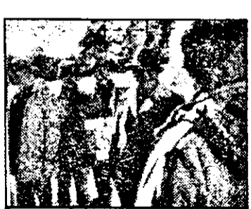
SAT 1: 1,20 Lacul lupilor - fact. SUA, 1978

9,00 Bună dimineața, Arad! 9,40 Forum studentesc 10,00 Film serial - Lumină călăuzitoare-ep.139-r. 10,50 Desene animate