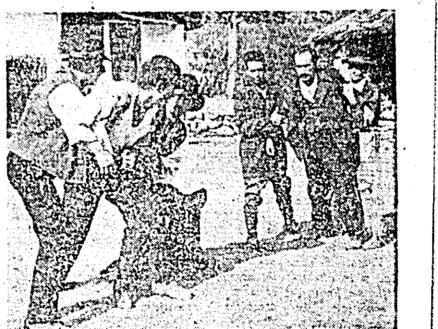
ÎN CLIȘEU: o secvență din film.

După cîțiva ani în care o boală l-a ținut departe de platoul