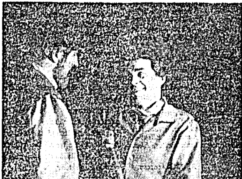
O scenă din piesa „Dincolo de zare”

și social al unor eroli de mari aspirații, umani și modesti, zdrobiți de vicisitudinile vieții capitaliste.