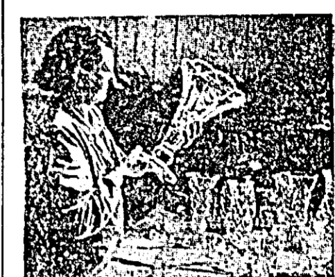
Cristalul cel și-a cucerit de mult o faimă mondială pentru calitatea și gustul cu care este lucrat.