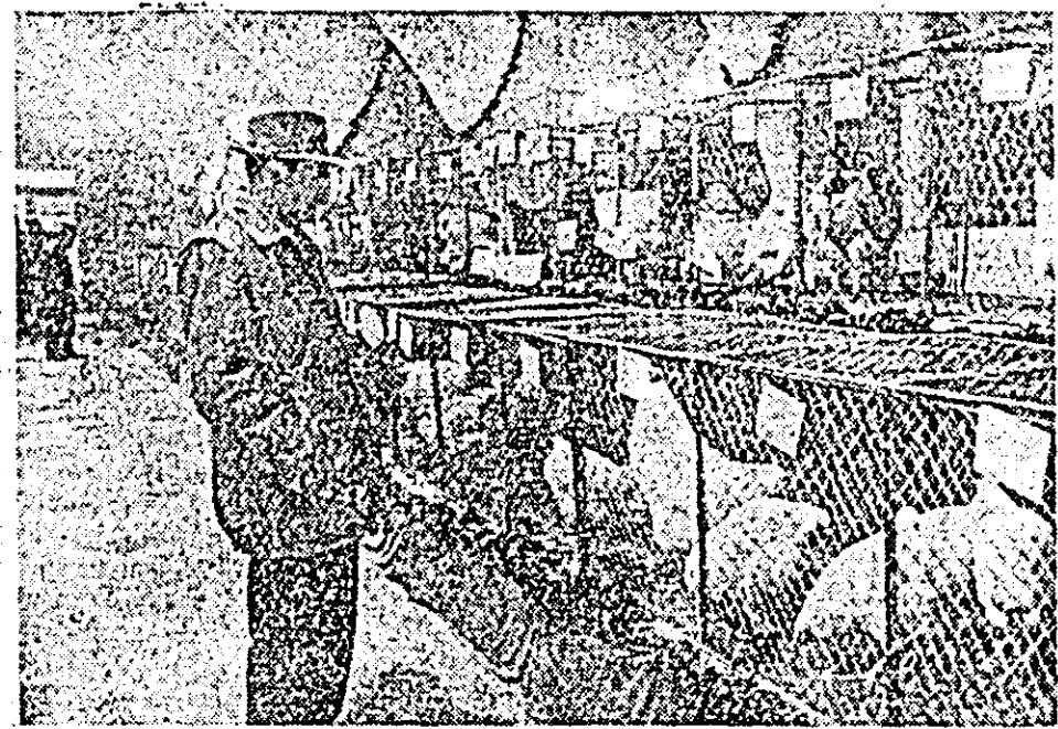
Zilele acestea s-a deschis în orașul nostru în hala de expoziții din piața Mihai Viteazul, Expoziția de păsări și animale mici. Ea este vizitată zilnic de către sute de cetățeni. ÎN CLIȘEU: un aspect de la expoziție.