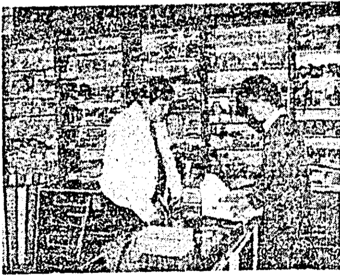
Aspect din noua librărie deschisă în comuna Semlac.