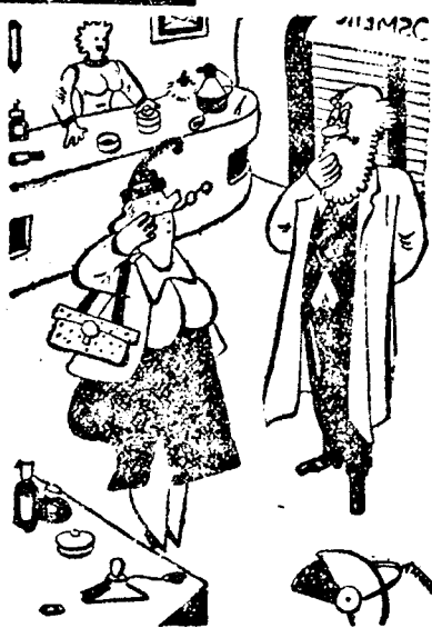
Mégis jobb lenne asszonyom, ha kezelés előtt közölném tiszteletdíj-igényeimet.

BEFEJEZÉSEHEZ KÖZELEDIK A MOTIU-CÉG NYÁRI VÁSÁRA. Az egyre nagyobb méretekben fejlődő Avram Iancu-terei divatáruház tulajdonosa MOTIU Illést, megkérdezte, megvan-e elégedve a nyári vásár eredményével?