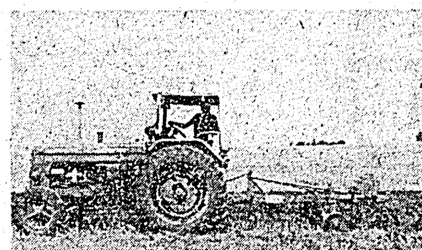
Grăbirea lucrărilor de arături este o sarcină importantă a mecanizatorilor. IN CLIȘEU: arături pe ogărele din Pecica.