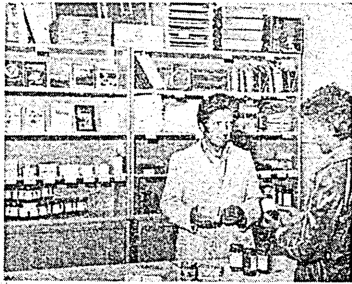
Asociația crescătorilor de albine, filiala județeană Arad, a deschis, recent, un nou magazin de prezentare în strada E. Potler nr. 26. Noul magazin pune la dispoziția apicultorilor diferite materiale, iar pentru populație, desfășoară produse și derivate apicole.