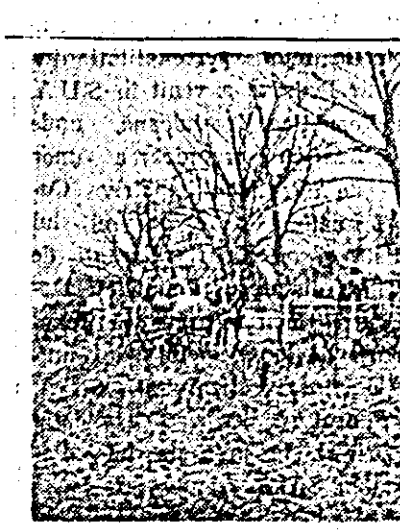
La întîlnirea în curtea gospodăriei, jurnalistul a surprins un aspect cotidian — țoștii întovărășiți, azi colectivizati, aduc în gospodărie caii, căruțele și alt inventar.

Comparația de pe panou s-a dovedit astfel a fi un bun îndrumător, ajutînd pe țărani muncitori să se convingă de avantajele gospodăriei colective.