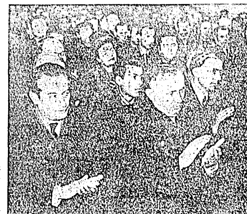
IN CLIȘEE: aspecte de la festivitatea decernării Diplomei de onoare Depoului CFR Arad.