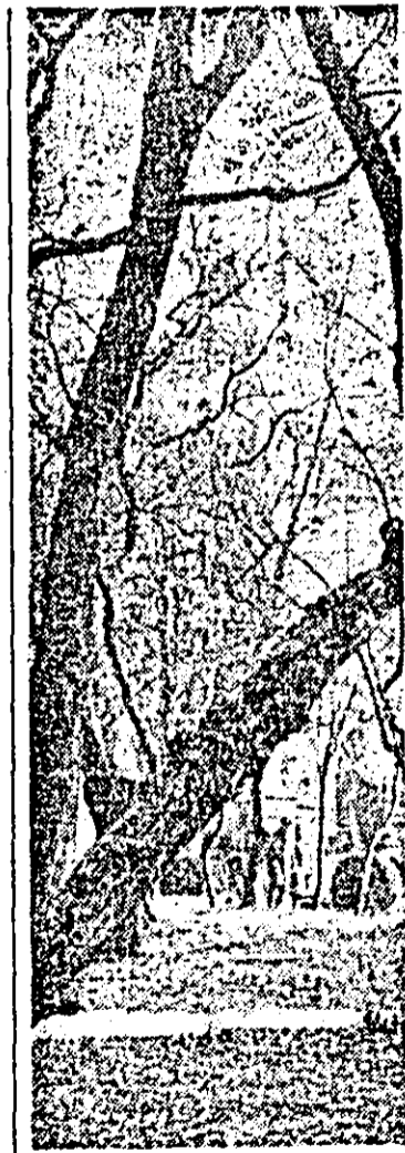
Zile de decembrie '85, în parc.